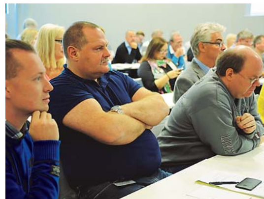
Konferansesuksess. Flere enn 90 tillitsvalgte deltok på konferansen på Gardermoen 19. og 20. september.

- Norge har klart seg gjennom finanskrisa uten å måtte bruke høyere arbeidsledighet som disiplinerende faktor. En ansvarlig lønnsutvikling er en forutsetning