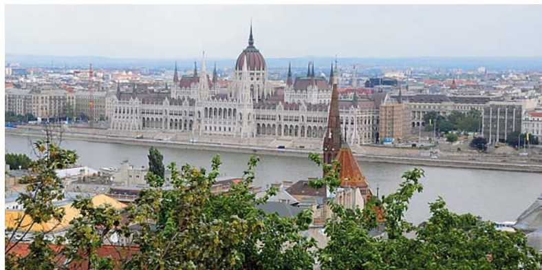
Vakre Budapest. Hovedstaden Budapest er en vakker by som deles i to - Buda og Pest - av elva Donau. Påkostete bygninger vitner om gammel storhet. Her ses den enorme parlamentsbygningen fra Buda-høyden.

Da finanskrisen slo inn for noen år siden rammet den Ungarn hardt, i likhet med mange andre land i det sentrale og sørlige Europa. De offisielle arbeidsledighetstallene ligger på 11 prosent, og blant ungdom er den betraktelig høyere. Det er tynt med jobber å velge i, og i tillegg er det svarte