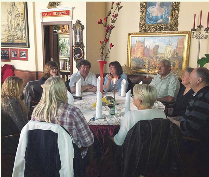
Aas-klubben kombinerte Gdansk-turen med årsmøte i klubben. Her er gjengen samlet til lunsj