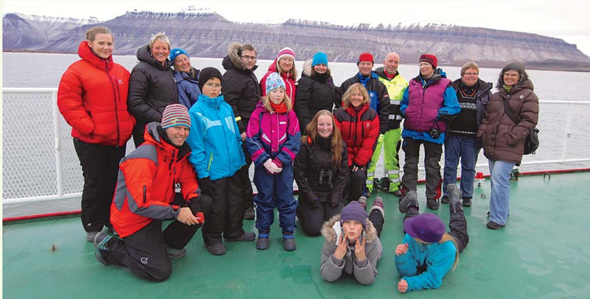
Fellesskap lengst nord. Store og små negotianere om bord på M/S Nordsyssel.

Den 10. september inviterte vi alle medlemmene i Negotia avdeling Svalbard på båttur. Familiemedlemmer var også velkomne, og 20 store og små entusiaster benyttet anledningen til å være med.