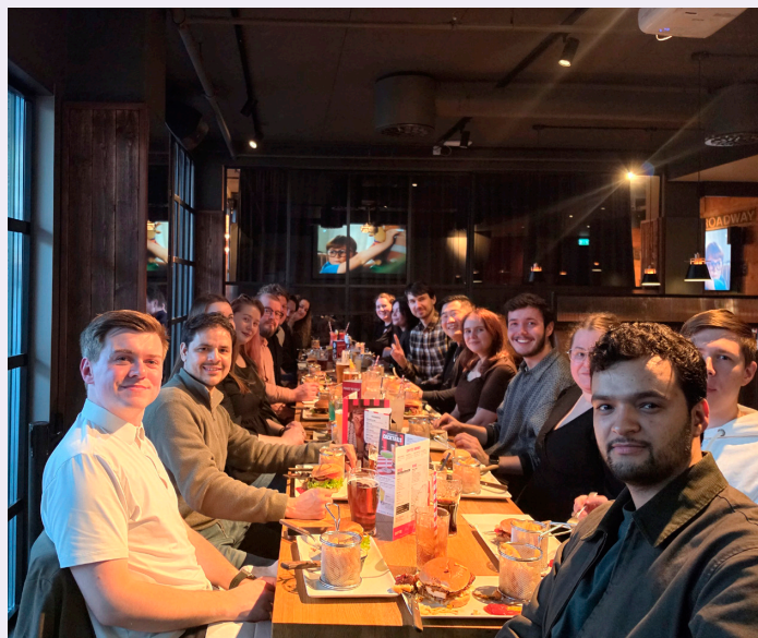
SOSIALT. Den regionale Ung-samlingen i Bergen i mars, samlet 20 medlemmer til nettverksbygging og sosial hygge.