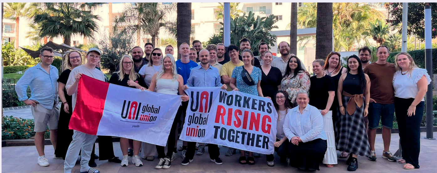
MANGFOLD. På UNI Youth sommerskole i 2026 var det 30 deltakere fra til sammen 11 forskjellige land. Hovedsaken på programmet var kollektive forhandlinger.